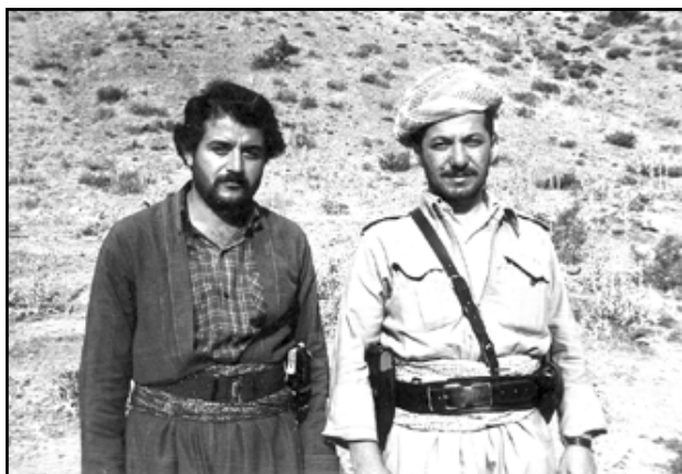
شەھید دگەل سەرۆک مسعود بارزانی ل دەقەرە لۆلان