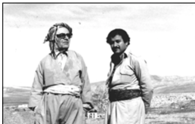
شەھید دگەل ھۆزانقانی نەمر ھەزار موکریانی ١٩٨٥/٥/١١