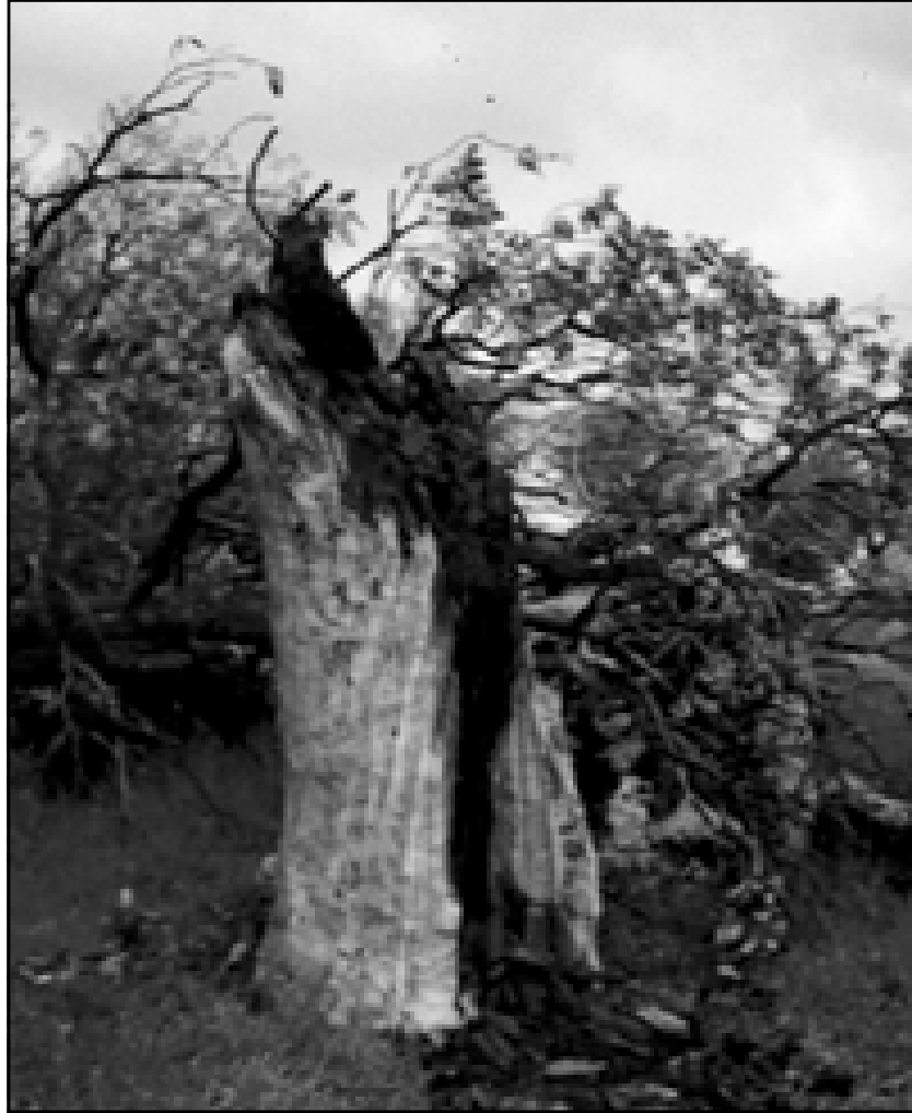
دارا شربین ل گورستانا نئہرزئی