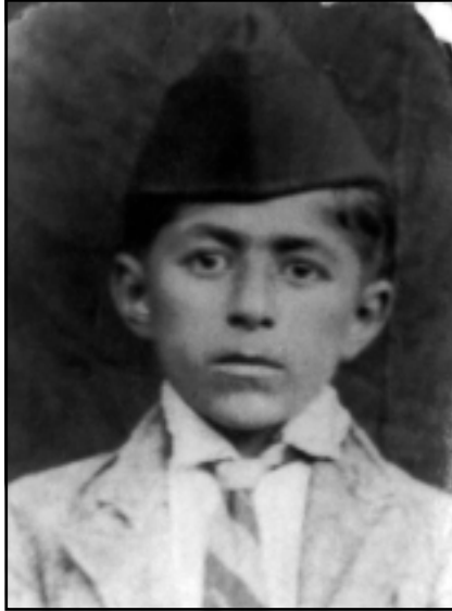
مههم له سالانى سيبهكاندا

المجلس التنفيذي لمنطقة كردستان الموقر/ اشارة للمخابرة اعلاه... للتفضل بالاطلاع مع فائق شكري وتقديري.