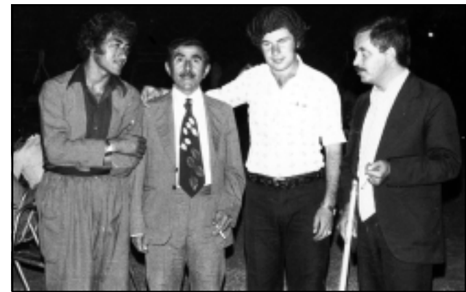
نافیع ئاکره‌یی له‌ ده‌ستی راست - مه‌م دووه‌مین له‌ چه‌په‌وه