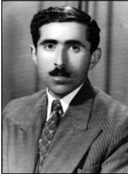
مههم له مولود - مههم - ي چيروكنوسوس و رۆژنامهوان و رۆماننوس